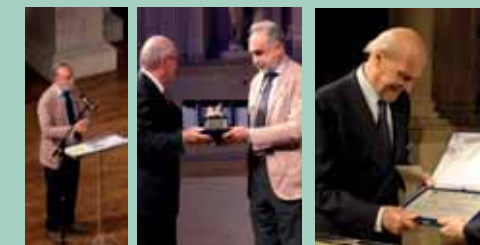
Il Premio Biennale di Cultura Medica