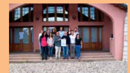
Scuola di Medicina Umanistica di Vicenza SMU