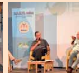
I Colloqui dell'Altipiano di Asiago, dialoghi su salute e benessere