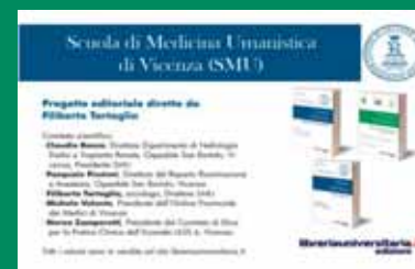
La Collana editoriale