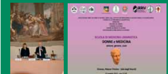
Convegni di Cultura Medica